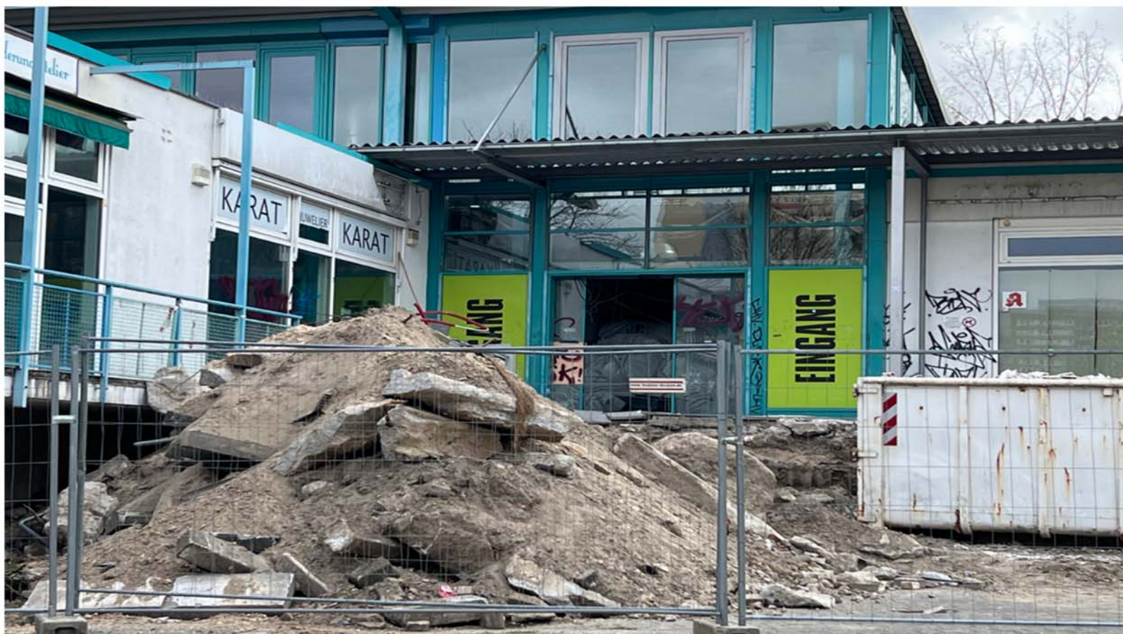
Das ehemalige Carré Marzahn an der Jan-Petersen-Straße zeigt sich aktuell als abgesperrte Baustelle mit Containern und ersten Rückbauarbeiten im Vorfeld des geplanten Hochhauses.