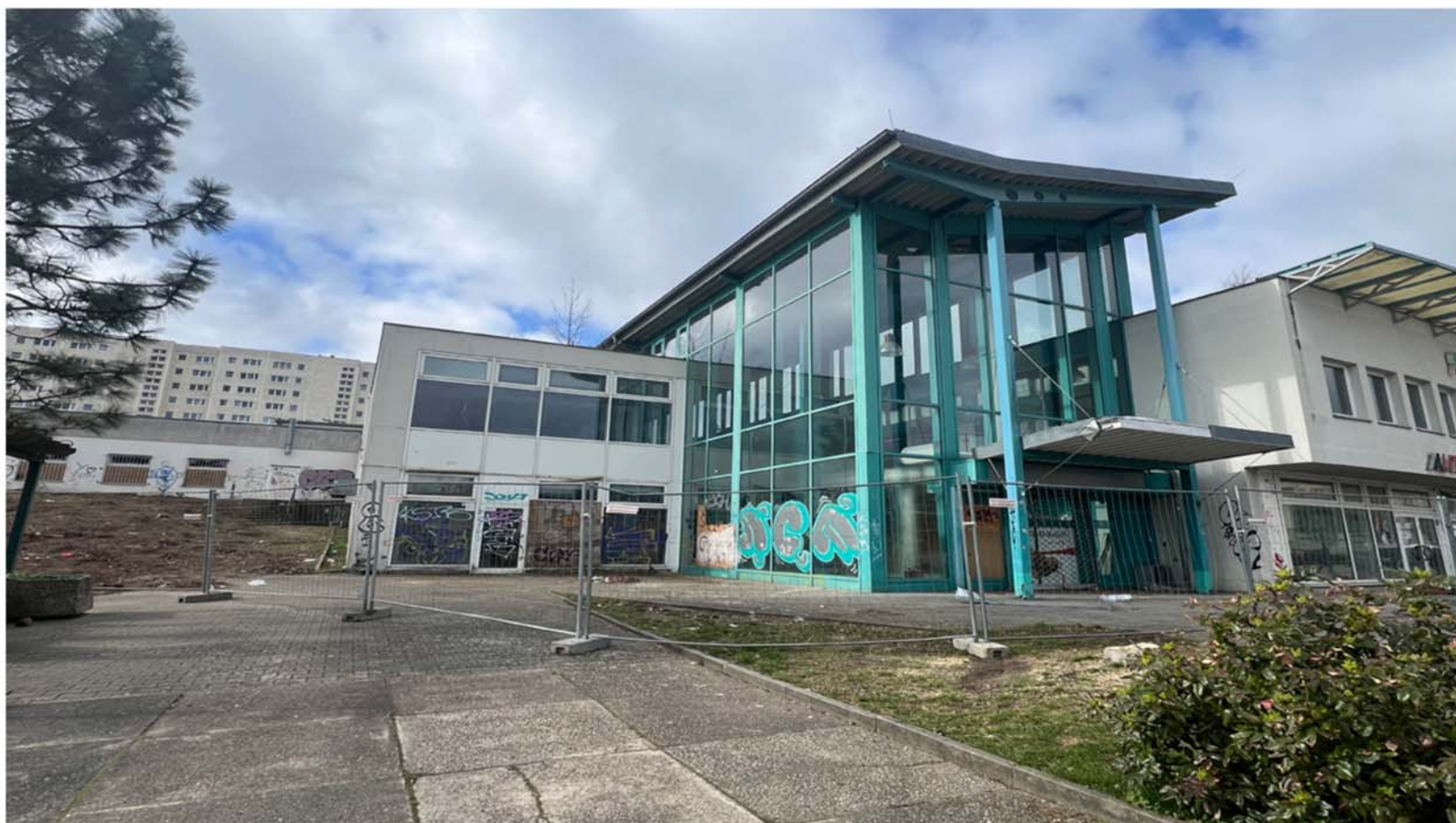
Ein leerstehendes Einkaufszentrum an der Jan-Petersen-Straße in Marzahn steht verlassen und mit Graffiti versehen auf dem Gelände des geplanten Hochhauses.

enemalige Gewerbeflächen sind erkennbar entkernt. Die Infrastruktur vor Ort wirkt unterbrochen, Wege sind beschädigt oder nicht mehr nutzbar. Der aktuelle Zustand des Areals an der Jan-Petersen-Straße zeigt also deutlichen Handlungsbedarf.