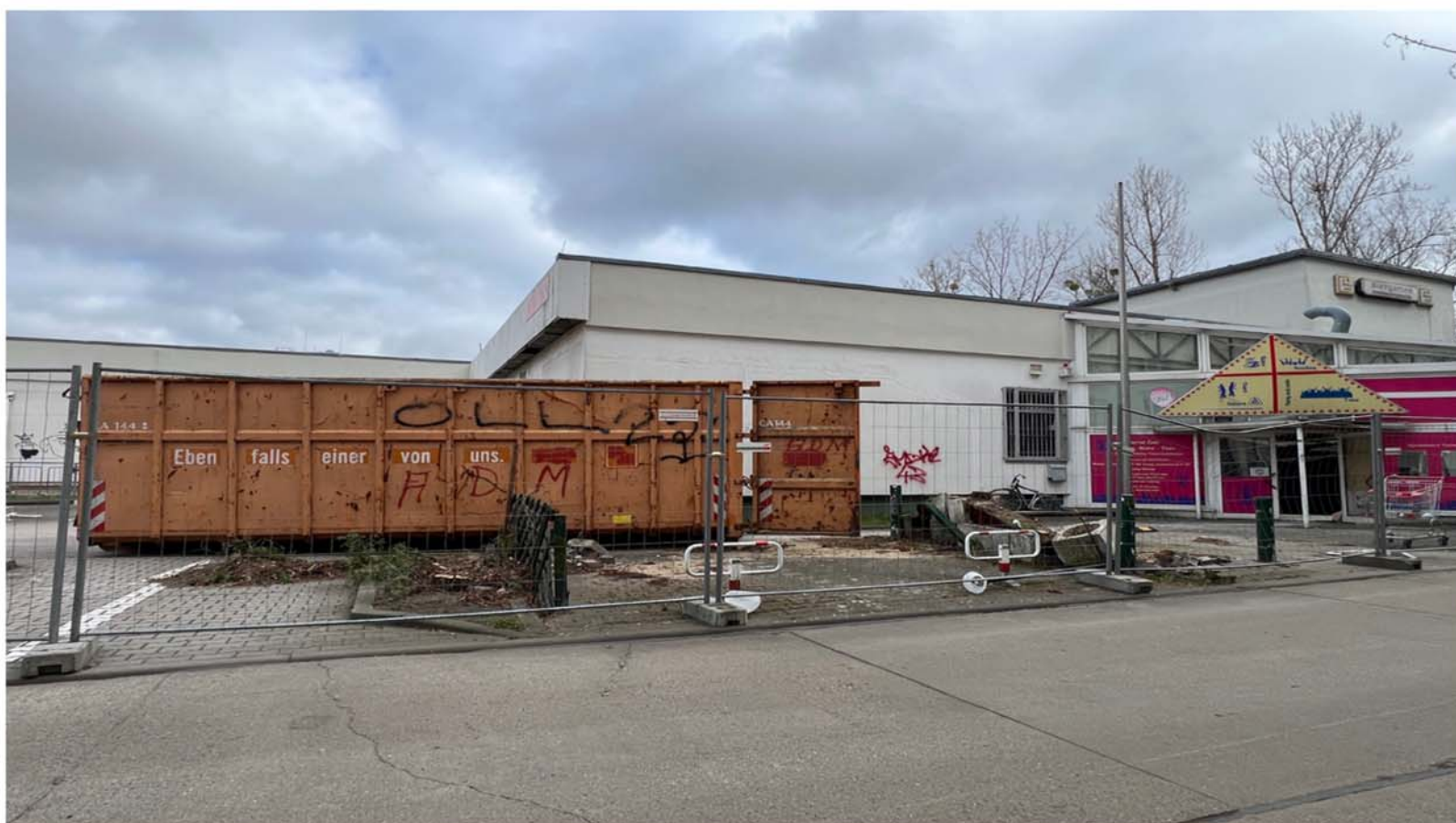
Das Areal an der Jan-Petersen-Straße in Marzahn ist aktuell geprägt von Abrissarbeiten, leeren Gewerbeflächen und Bauzäunen im Vorfeld des Neubaus.

Der Standort zählt bislang zu den günstigeren Wohnlagen in Berlin. Laut aktuellen Marktdaten liegt die Angebotsmiete im Postleitzahlengebiet 12679 unter dem Berliner Durchschnitt. Genau dort planen die Unternehmen CRX Real Estate und Greystar ein Projekt, das vor allem auf kleine Wohnungen setzt. Das Bezirksamt sieht in der Entwicklung eine Chance, da das Grundstück seit Jahren ungenutzt ist und sich sichtbar verschlechtert hat.