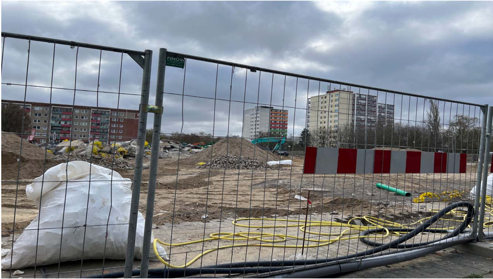
Beim Hochhaus-Projekt in der Hohensaatener Straße in Marzahn sollen 375 Wohnungen entstehen.

In Berlin-Marzahn entsteht an der Hohensaatener Straße ein Wohnquartier mit 375 Wohnungen, Gewerbeflächen und Grünanlagen. Die Gebäude erreichen unterschiedliche Höhen und reichen bis zu 17 Geschosse.