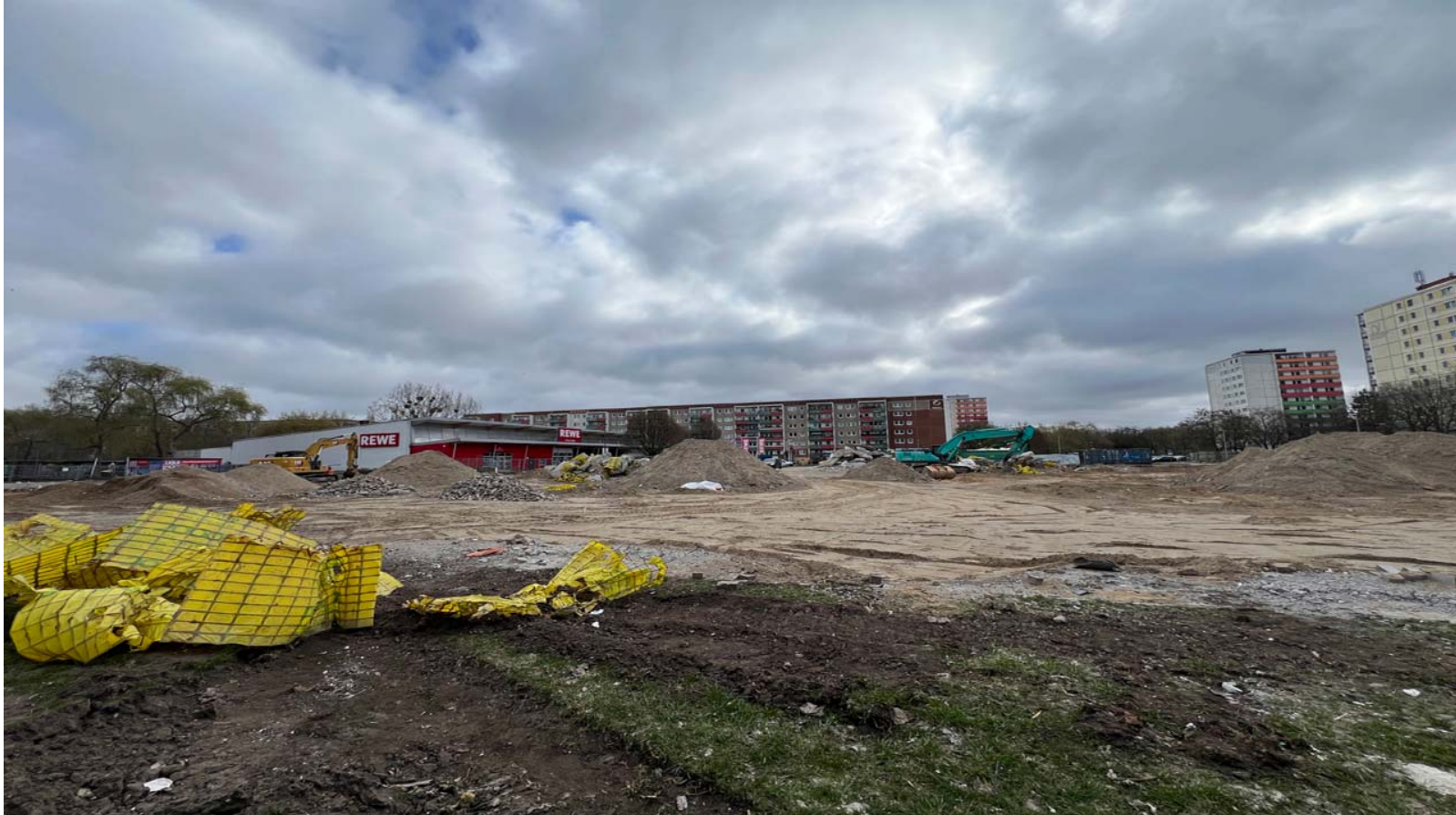
Blick über das zukünftige Wohnquartier in Marzahn: Hier entsteht bis 2028 eine neue Wohnanlage an der Hohensaatener Straße.